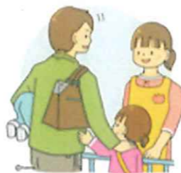
「教育力向上福岡県民運動 ホームページ」より抜粋